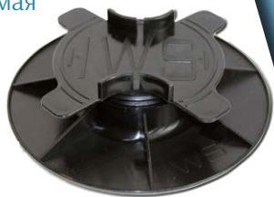
Высоты 30–50 мм, точность регулирования 0,5 мм