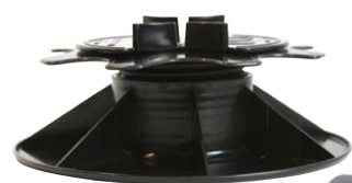
Регулируемая опора для лаг «IWS 5-9» в сборе