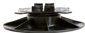
Регулируемая опора для лаг «IWS 3-5» в сборе

3.2 Не используйте прокладок при установке регулируемых опор на гидроизоляцию, устанавливайте опоры непосредственно на гидроизоляцию.