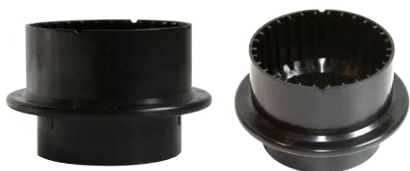
Регулируемая опора для лаг «IWS 5-9»+ «IWS V»