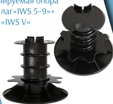
Высоты 149–182 мм, точность регулирования 1,0 мм