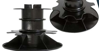
Высоты 116–149 мм, точность регулирования 1,0 мм